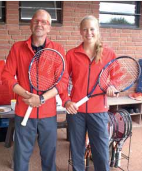
Kooperationspartner Fa. Motschnigg

se mit einem 4. Platz gut behaupten, und wird dort in der kommenden Saison mit weiteren Verstärkungen in der Mannschaft wieder angreifen. Ebenfalls aufgestiegen ist, mit einem herausragenden Ergebnis von 12:0 Punkten, unsere Herren 40. Die Herren 50 hatte in der 2. Bezirksklasse ordentlich zu kämpfen, verlor einige Spiele aber auch sehr unglücklich und nur knapp nach hartem Kampf.