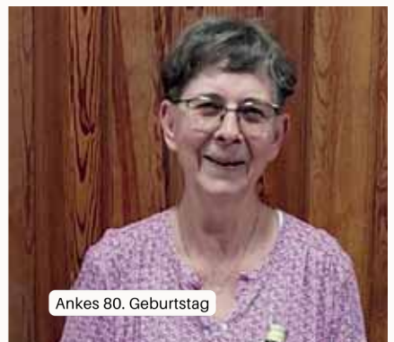
Ankes 80. Geburtstag