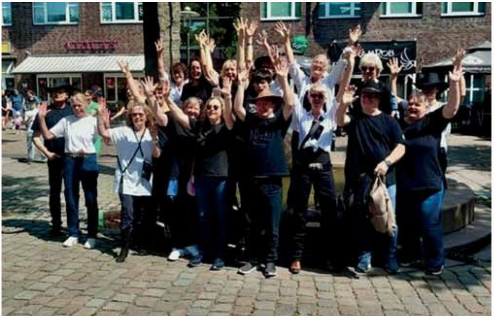
Auftritt beim Stadtfest in Ahrensburg