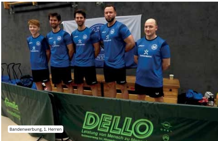
Bandenwerbung, 1. Herren