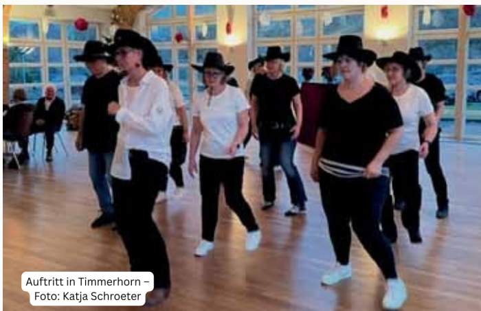
Auftritt in Timmerhorn

Zudem wird es wieder einen Tag der offenen Tür mit Workshops und Tanzparty geben, um sowohl Anfänger als auch erfahrene Tänzer zu fördern. Die Crazy Boots freuen sich darauf, auch dieses Jahr mit Leidenschaft und Freude die Vielfalt des Linedance zu leben und weitere Menschen für diesen tollen Sport zu begeistern.