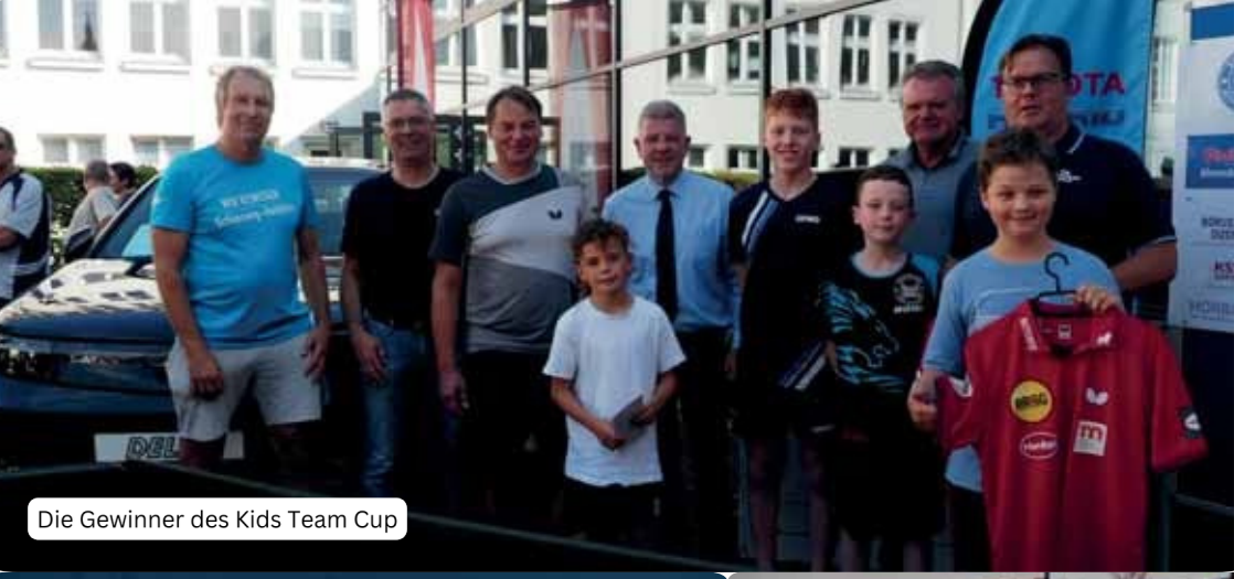
Die Gewinner des Kids Team Cup