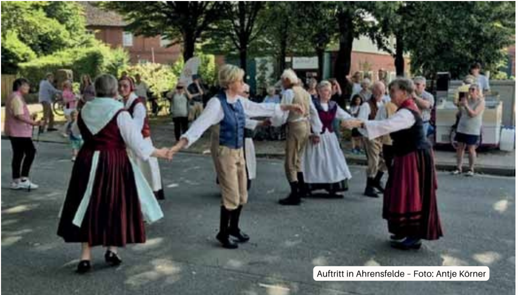
Auftritt in Ahrensfelde