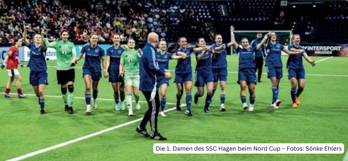
Die 1. Damen des SSC Hagen beim Nord Cup