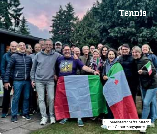
Clubmeisterschafts-Match mit Geburtstagsparty